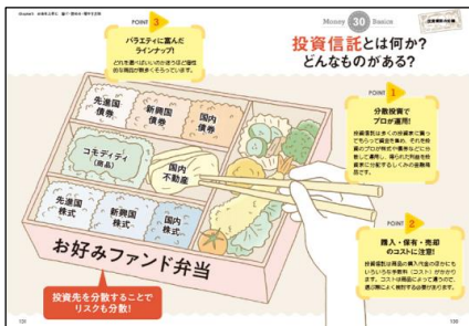
※現行版「サクッと教養お金の基本」より