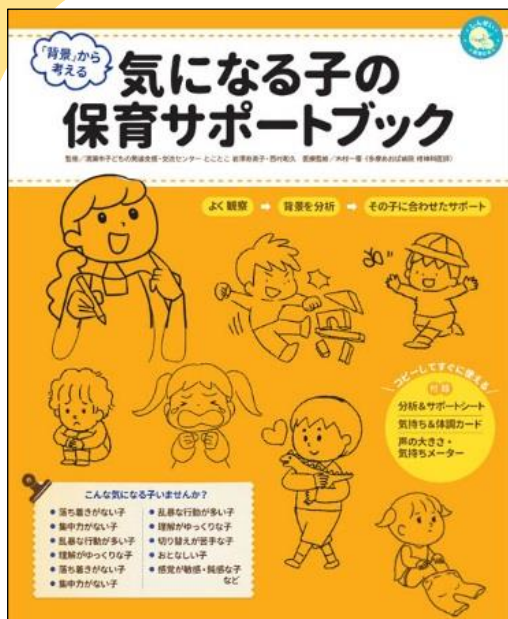
※装丁・画像はすべて仮画像です。